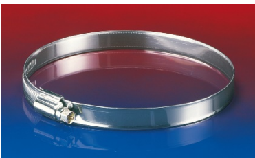
SHS – Schlauchschelle zur Befestigung von leichten aussen glatten Schläuchen.