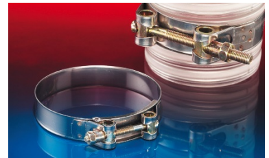
SHSB – Gelenkbolzenschelle zur Befestigung von schweren und aussen glatten Schläuchen