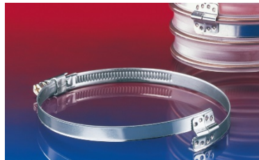
BS – Brückenschelle zur Befestigung von aussen gewellten Schläuchen.